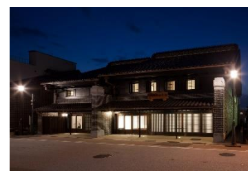
[ 整備後 ]