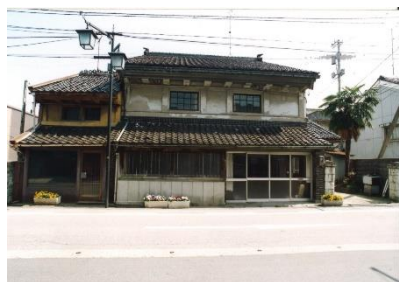
[ 修理前 ]