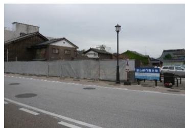
[ 整備前 ]

重要有形・無形民俗文化財に指定されている「高岡御車山」を展示する会館を整備した。(平成28年12月ユネスコ無形文化遺産に登録)