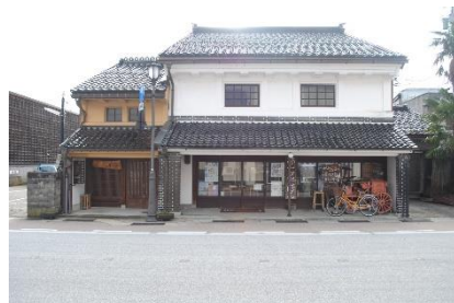
[ 修理後 ]