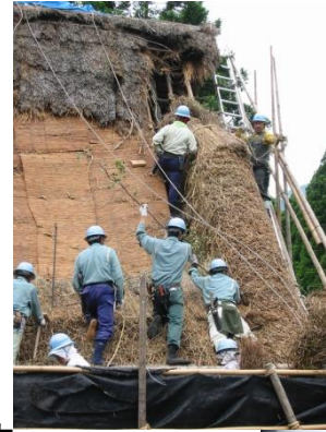
森林組合による 葺替え技術の伝承