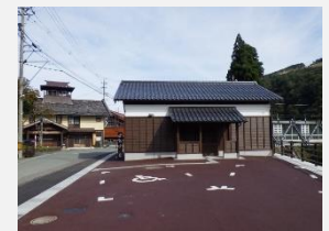
駐車場と便益施設