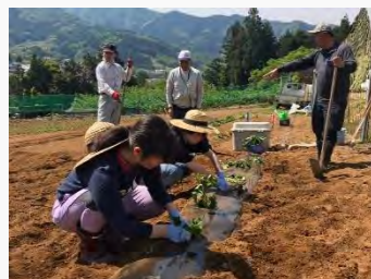
さつまいも苗植え付け