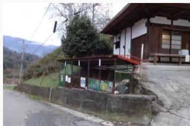
景観改善事業 実施前