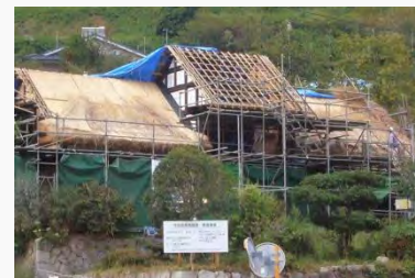
工事中の甲州民家情報館