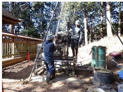
ボーリングによる地質調査

今後、建造物の修理・修景事業を推進し、歴史的な町並みを後世に継承していくための方策を定め、同時に地区住民の防災意識の向上を図る。