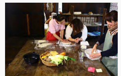
情報館でのほうとう作り体験