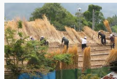
茅葺きワークショップ