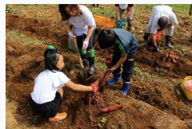
さつまいも収穫祭