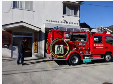
地元消防団へのヒアリング