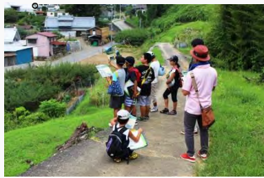
上条地区歴史探訪

調べた内容に写真やイラストを織り交ぜながらまとめ、その成果を学校行事や地元のシンポジウム等で発表し、身近にある保存地区の歴史の再認識につながっている。