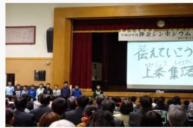
神金シンポジウムでの発表