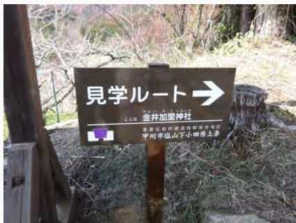
見学ルート誘導板