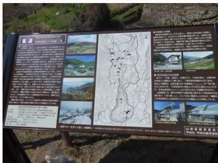
重伝建地区の説明板

見学ルートを設定することにより、日々生活されている住民のプライバシー保護を図りながら、保存地区内の魅力を伝え、快適に散策していただくことが可能となった。