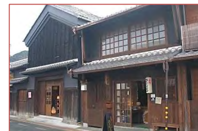
美濃和紙あかりショップ