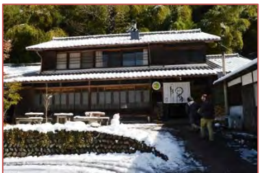
昭和初期の建物を改装したカフェ&ゲストハウス(樋ヶ洞)