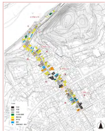
旧牧谷街道の重点地区