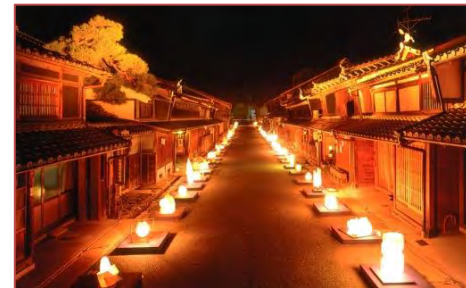
美濃和紙あかりアート展

うだつの上がる町並みが重伝建地区に選定される以前の、平成6年から開催されている美濃和紙あかりアート展は、毎年10月の第2土・日曜日の2日間開催されているが、このイベントは中高生、ライオンズクラブ、JC、商工会議所など地域の各団体から延べ400人へのぼるボランティアにより支えられている。うだつの上がる町並みに賑わいを取戻そう、活性化しようと地域住民の発案で始められた。美濃市を代表するこのイベントは、地域住民に支えられ、多くの人々を魅了している。