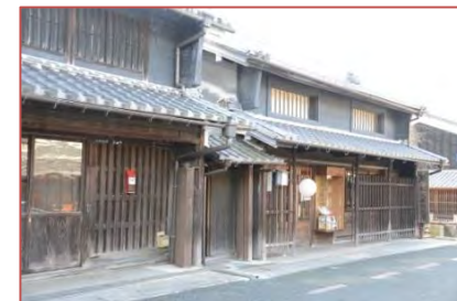
老舗:明治から営まれる和紙問屋