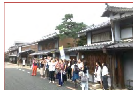
国際研修「紙の保存と修復」東京文化財研究所・ICCROMIにおける町並み案内ボランティア

うだつの上がる町並みを観光客に説明していく中で、最も意識していることは歴史的町並みを保存することだけではなく、各町内で営まれる伝統行事や風習を受け継いでいく住民の意識を伝えることである。美濃まつりや美濃流しにわか、夏に行われる秋葉様の祭礼などが一体となって守り、次の世代に伝えようとする住民意識があるからこそ、この町並みが維持されることを、多くの方々に説明している。