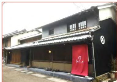
江戸時代の建物を改装した宿泊施設

保存地区から離れた樋ヶ洞地区や蕨生地区においても、歴史的建造物をカフェやゲストハウスに活用した建物が民間により開業しており、地区外にも歴史的建造物を活用したまちづくりが波及している。