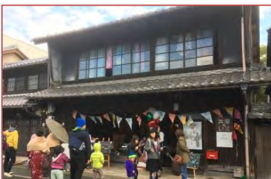
NPO法人多目的ギャラリー