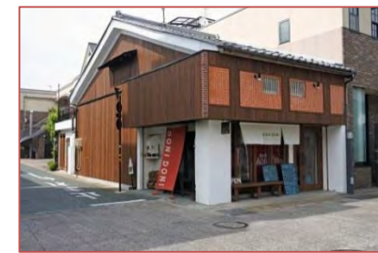
イタリアレストラン