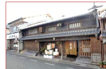
老舗:江戸時代から営まれる造り酒屋