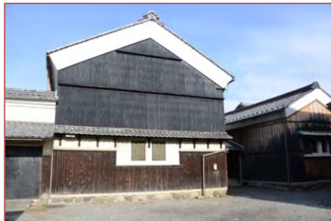
美濃和紙の原料蔵として使われた 旧松久邸別邸(上・下)

また現在、市が所有する旧美濃和紙原料蔵や数奇屋造りの建物を宿泊施設や和紙販売施設として改装が行われ、令和元年7月に開業した。