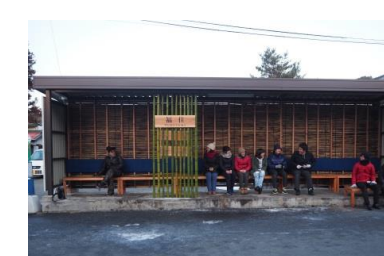
竹を活用したバス停修景