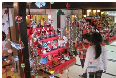
丹波篠山ひなまつり