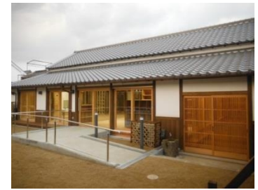
放課後児童健全育成施設(今井学童クラブ)