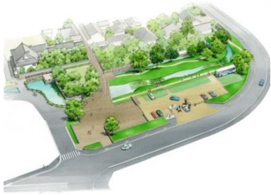
環濠復元的整備イメージパース 今井西地区エリア(駐車場も確保)