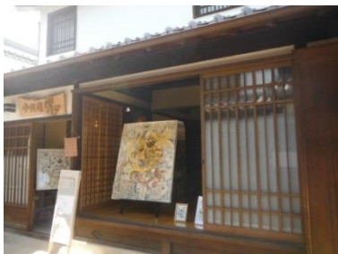
芸術祭「はならあと」

奈良県内の町家と芸術作品を組み合わせ、地域独特の文化や暮らしを受け継ぎ、再発見するイベントが行われている。重要文化財や空き家を活用し、展示スペース等として提供することで空き家対策の一翼を担っている。