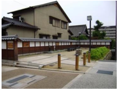
地区防災施設(防火水槽等を設置)