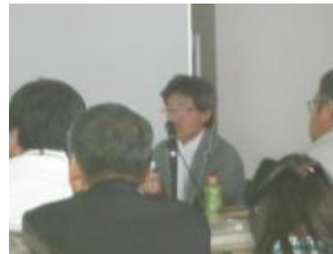
今井まちなみ再生ネットワーク理事長

「今井町を知ったきっかけは、テレビCMで使われていたのを見て。挨拶や声かけといった、人と人とのつながりの温かさを感じることができるところが、魅力だと思う」