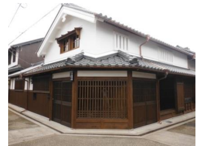
医大ゲストハウス(奈良県立医科大学との共同事業)