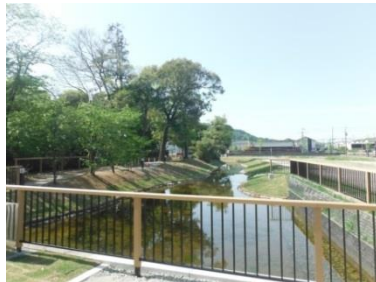
防災機能を有する 旧環濠の復元的整備