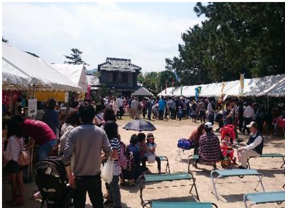
萩・夏みかんまつり(平安古)