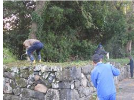
住民による清掃活動(堀内)