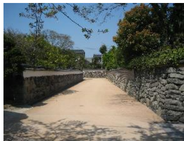
堀内鍵曲環境整備