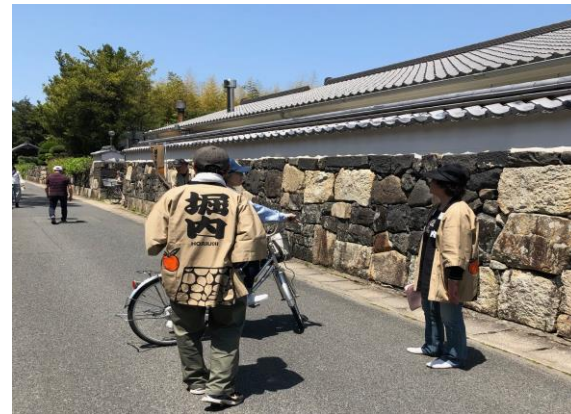
城下町萩・堀内散策