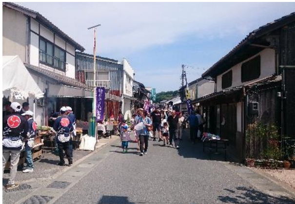
浜崎伝建おたから博物館