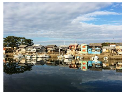
港の周囲に伝統的民家が立ち並ぶ漁村集落の景観