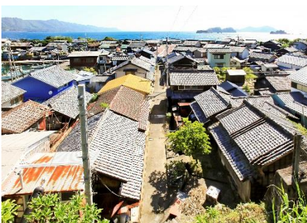
安政地震後に浜を埋立て計画的に宅地整備された新町地区