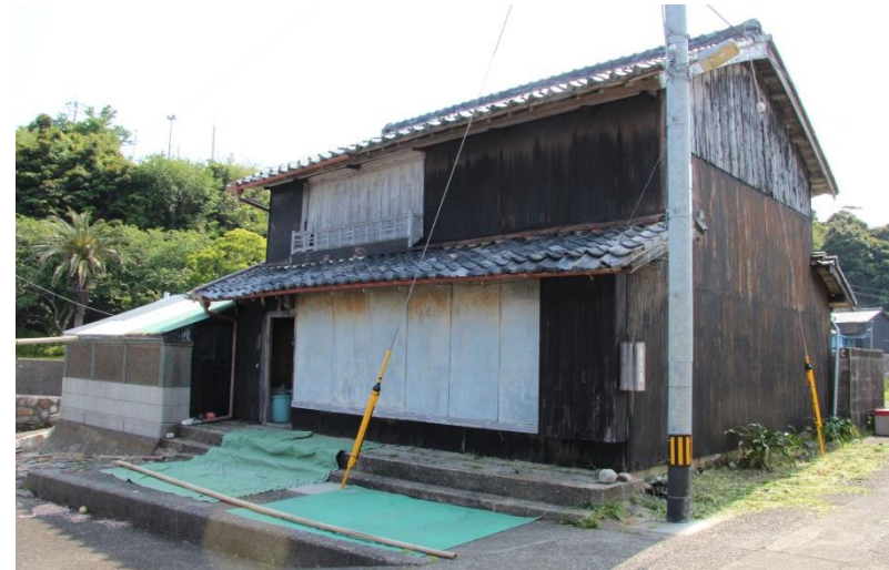
平成27年度 出羽島交流施設「波止の家」の整備