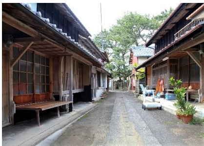
町屋型の民家が連続する西波止・本町地区