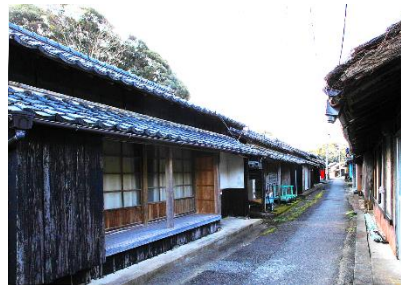
地区開発時の伝統的な町並みが色濃く残る洲鼻地区