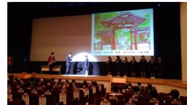
町並み絵画コンクール 表彰式