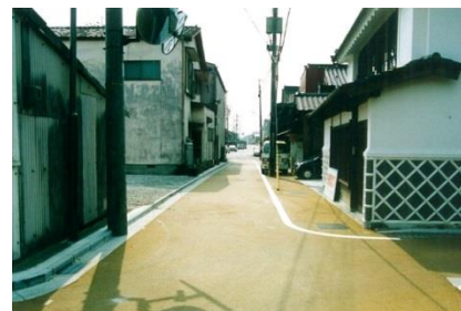
道路のカラー舗装(美装化)