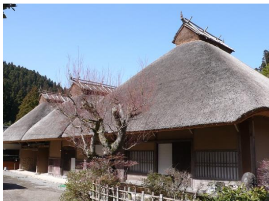
国指定重要文化財 平川家住宅(一般公開) 18世紀後期に建てられた凹型寄棟造の茅葺住宅