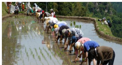
棚田の田植え(棚田オーナー制度)