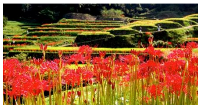
彼岸花めぐり&ばさら祭り