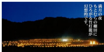
本村地区 棚田のお月見会