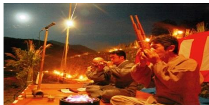
本村地区 棚田のお月見会