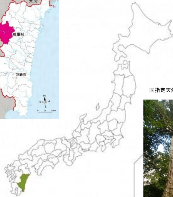
国指定天然記念物「八村杉」