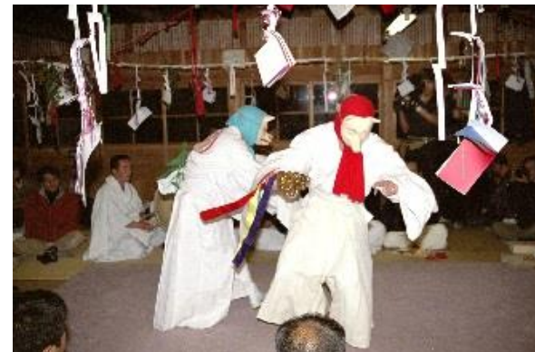
国指定重要無形文化財 「十根川神楽」

毎年11月の第3日曜日に、伝建地区内にある十根川神社の境内において臼太鼓踊りが奉納される。