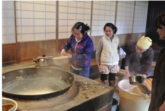
菜豆腐づくり体験