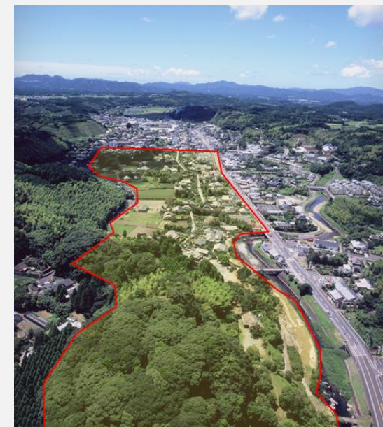
東から保存地区(赤枠)を望む 手前は「亀甲城跡」