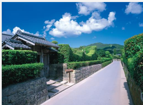
本馬場通り(石垣・生垣と武家門)