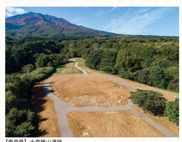
【青森県】大森勝山遺跡

日本の世界遺産 アジアの最東端に位置し、四方を海に囲まれた日本は、四季折々に多様な表情を見せる豊かな自然に恵まれてきました。日本は長い歴史の中で、大陸を始めとする諸外国の文化を巧みに取り入れながら、その変化に富んだ自然に培われた感性に根ざした独自の文化を育んできたのです。 日本では、国民の文化的向上に資すると共に世界文化の進歩を図るため、文化財保護法や各地方自治体の定める文化財保護条例によって、有形と無形の文化遺産を、それぞれの特性に応じて保護しています。 また、国土の豊かな自然や生物多様性を保全するため、自然公園法や自然環境保全法等の法制度が整えられています。 近年、地域におけるボランティアやNPOの活動により、国民一人一人が文化財や自然に親しむ機会が増え、文化や環境の保護を行う試みが活発になっています。 私たちは、ユネスコの精神に従い、この素晴らしい遺産を世界の人々に伝えるとともに、未来の世代へ受け継いでいきたいと考えています。