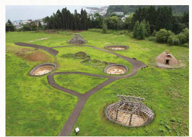
【北海道】大船遺跡