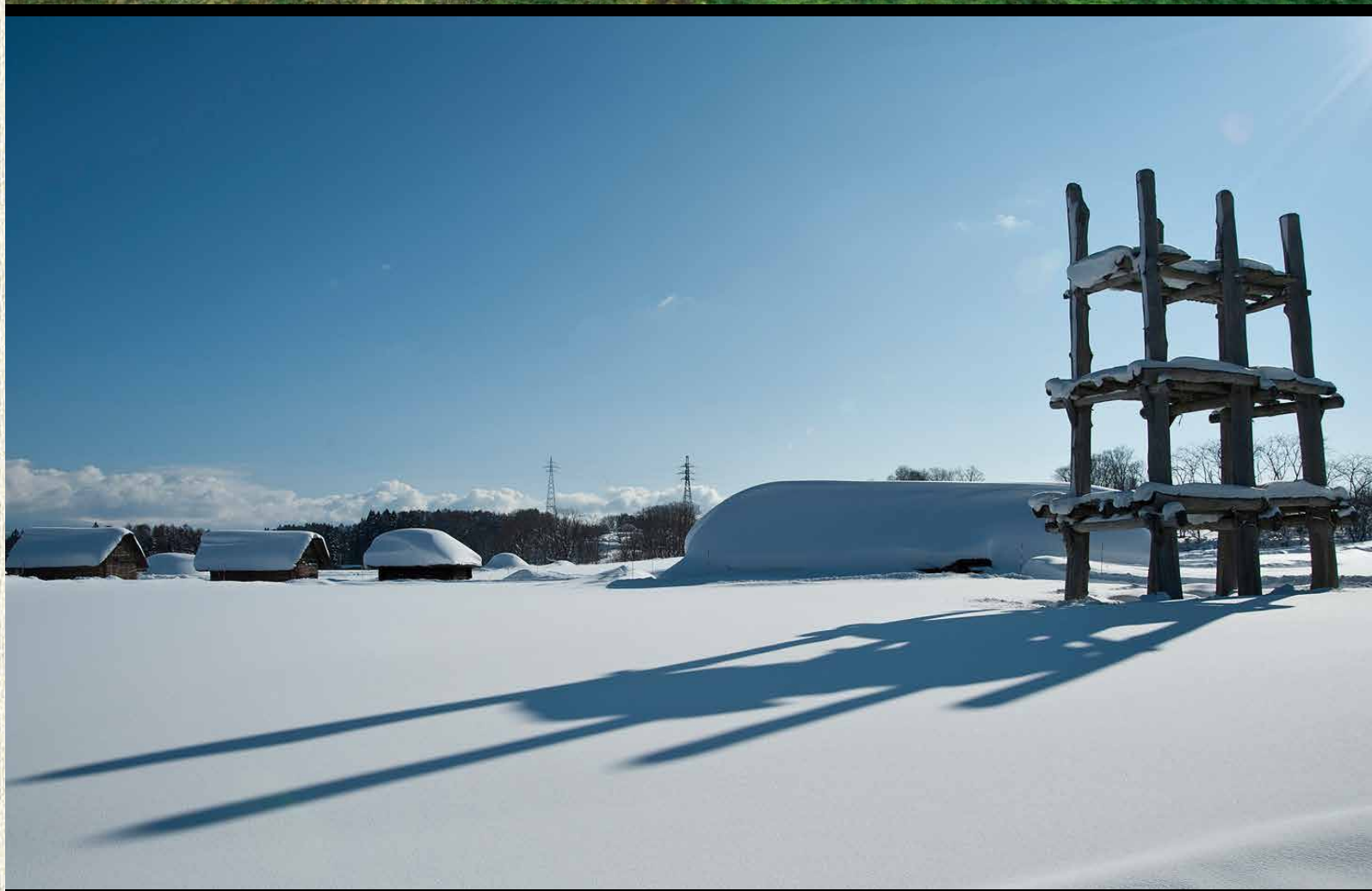
表紙写真：【岩手県】御所野遺跡 (出典：JOMON ARCHIVES) 裏表紙写真：上：【北海道】北黄金貝塚 (出典：JOMON ARCHIVES) 下：【青森県】三内丸山遺跡 (出典：JOMON ARCHIVES、青森県教育委員会撮影)