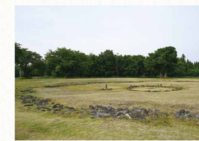
【秋田県】大湯環状列石

2021年7月現在、日本の世界遺産は25件登録されています。 世界遺産条約は1972年にユネスコで採択され、2021年7月現在、194か国が締結しています。日本も1992年にこの条約を締結し、文化遺産及び自然遺産を人類全体のための世界の遺産として損傷、破壊等の脅威から保護し、保存することが重要であると考え、国際的な協力・援助体制の構築に貢献してきました。 世界遺産は各国からの推薦を受け、21か国で構成される世界遺産委員会の審査を経て登録されます。2021年7月現在、世界遺産は文化遺産897件、自然遺産218件、複合遺産39件を含む1,154件に上り、そのうち日本からは文化遺産20件、自然遺産5件の計25件の世界遺産が登録されています。