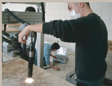
科学分析(顔料等調査)の様子