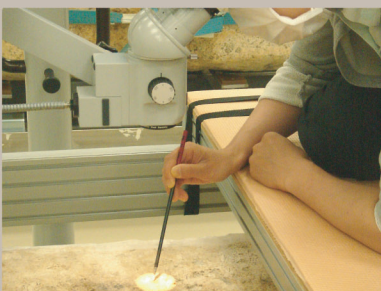
顕微鏡下で、修理作業を行う