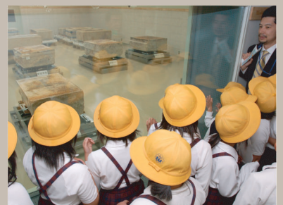
平成20年 春の公開時の様子