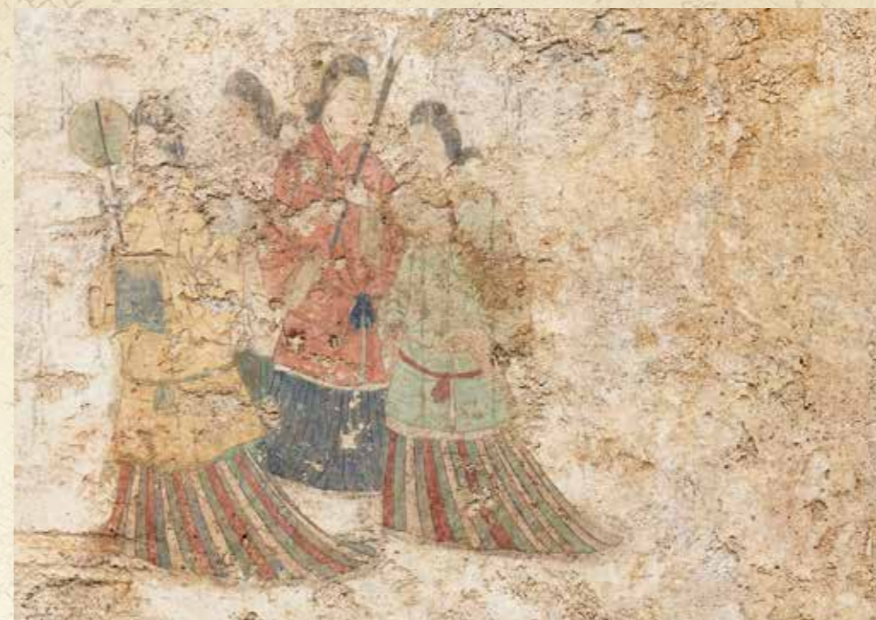
西壁女子群像 (平成30年撮影)