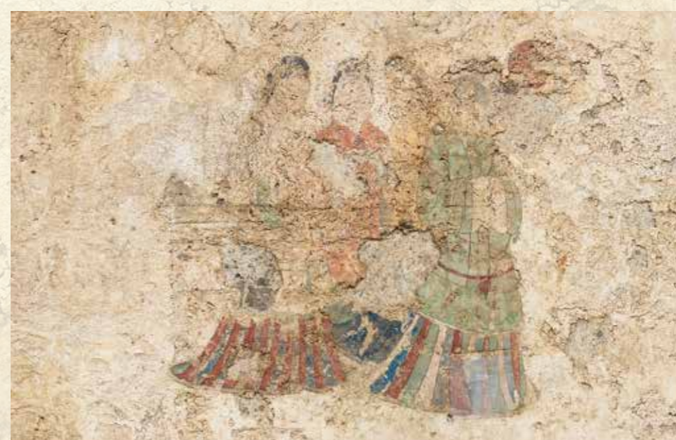
東壁女子群像 (平成30年撮影)