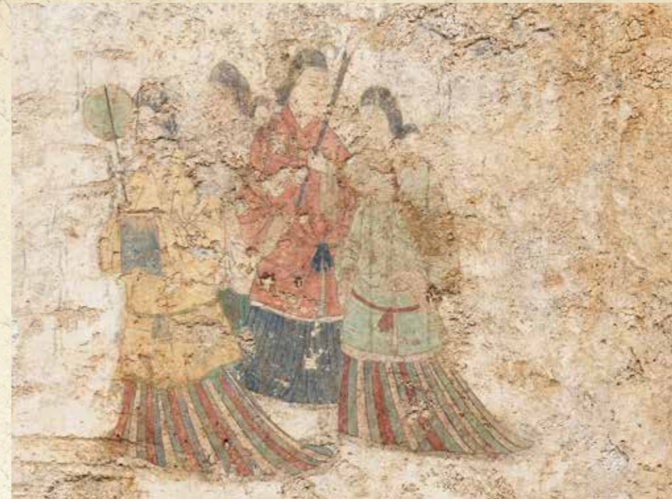
西壁女子群像 (平成30年撮影)