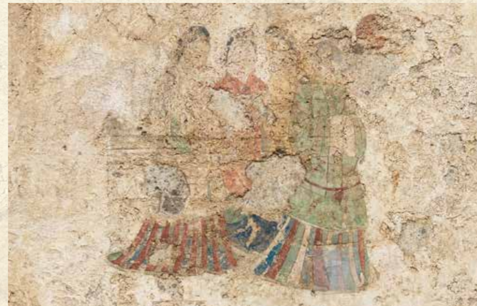
東壁女子群像 (平成30年撮影)