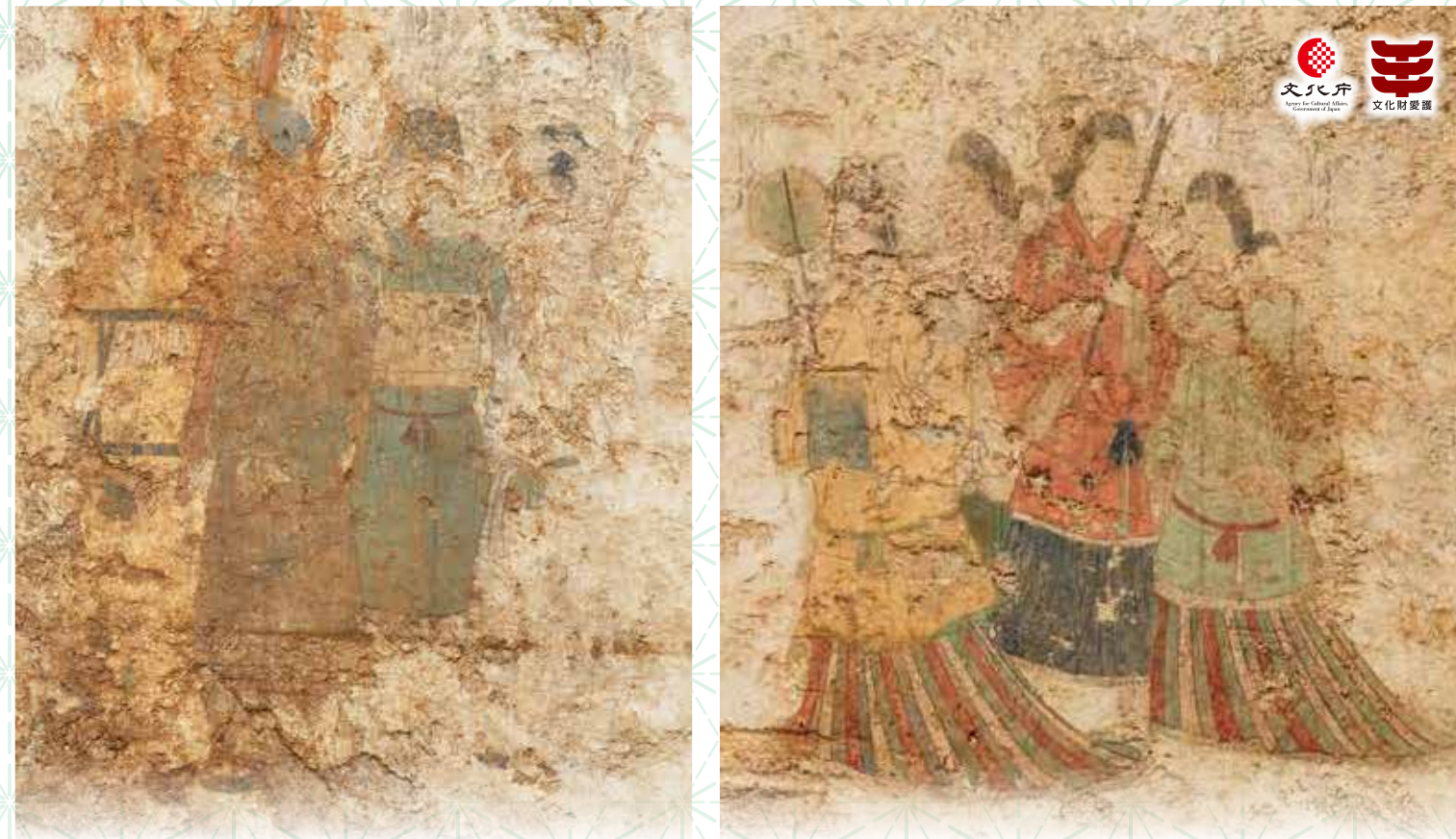
西壁男子群像・西壁女子群像(令和元年撮影)