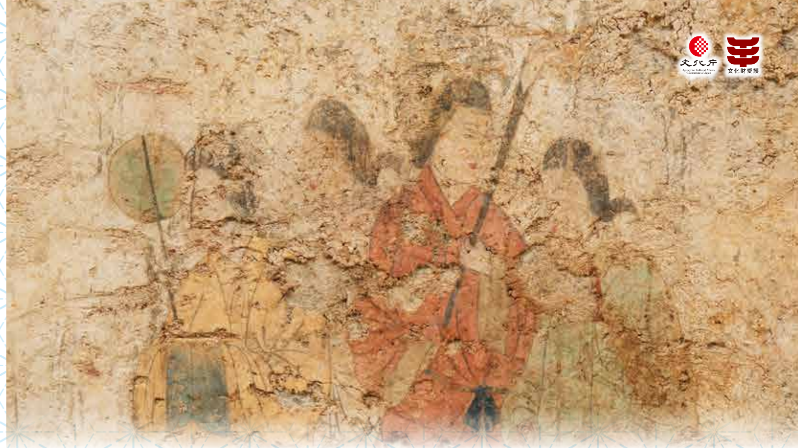
西壁女子群像(令和元年撮影)