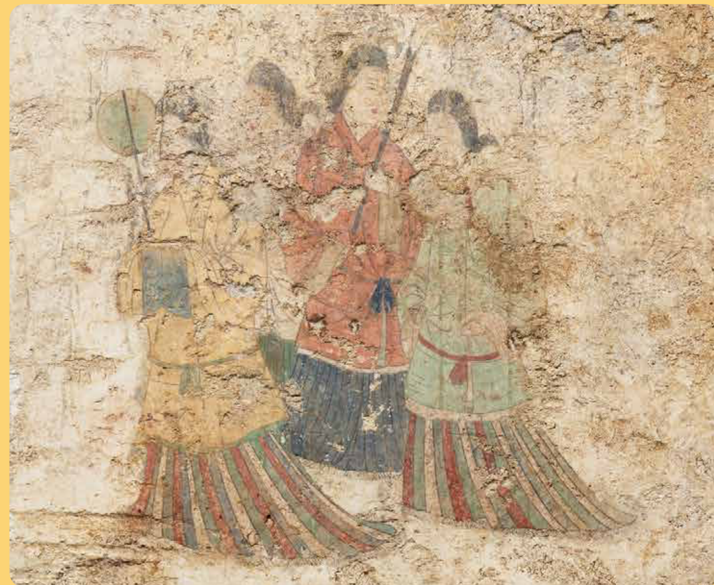
西壁女子群像(令和4年2月撮影)