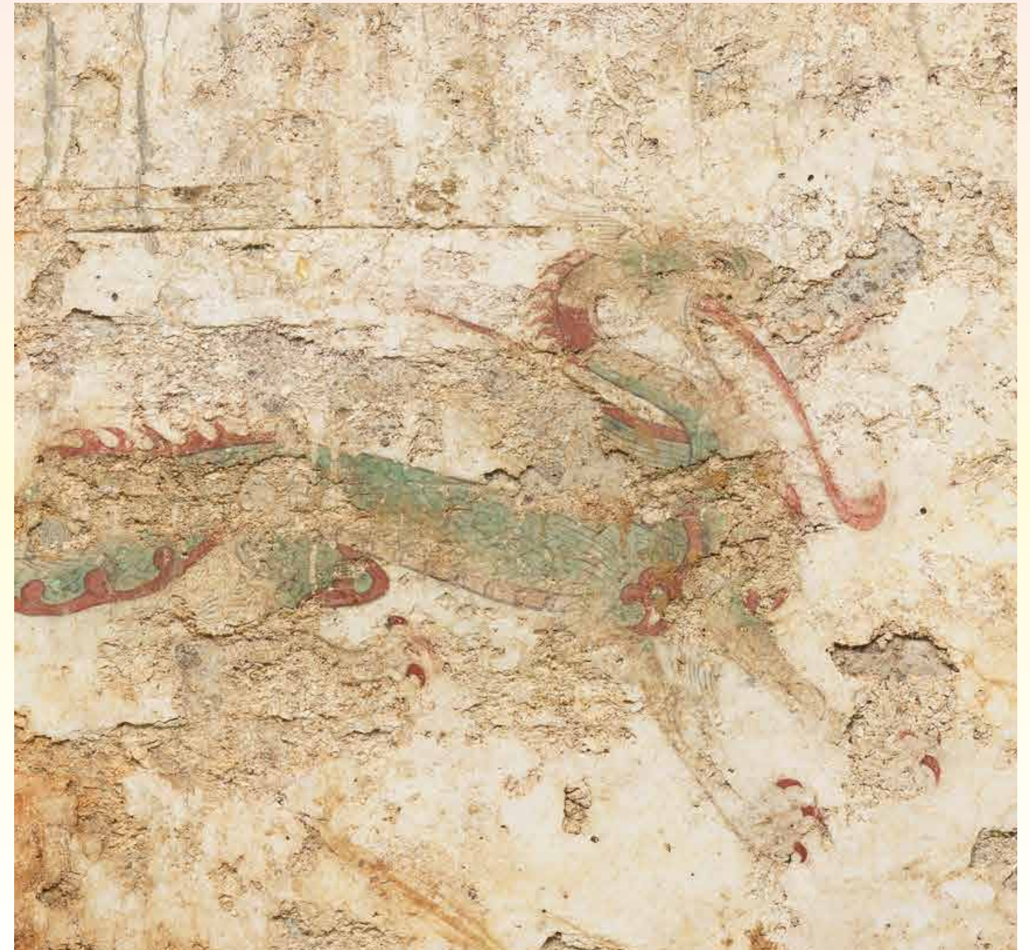
東壁青龍(令和5年2月撮影)