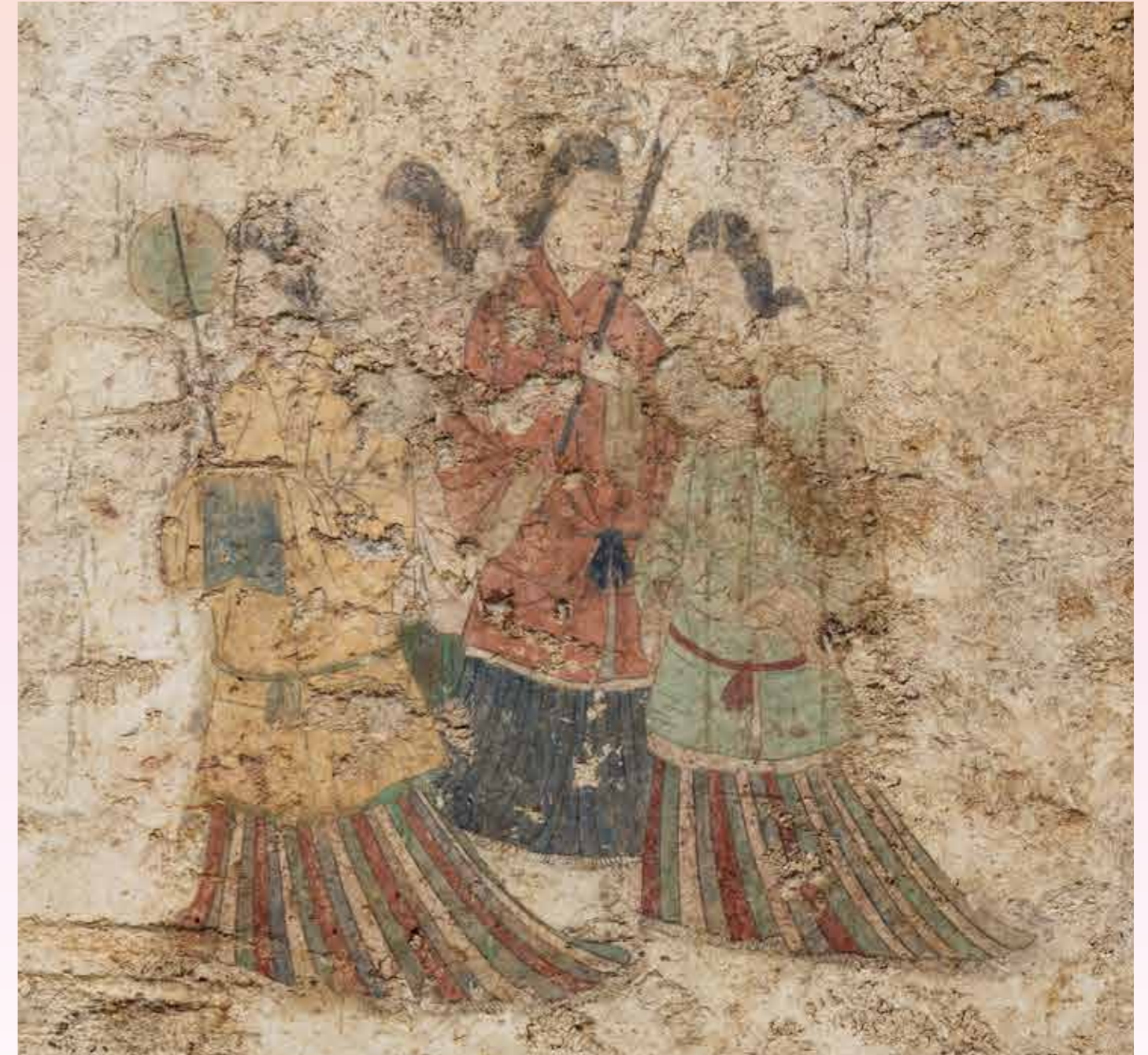
西壁女子群像(令和4年11月撮影)