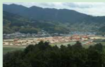
甘樫丘から見た飛鳥京