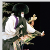
「奥州安達原」安倍貞任・安倍宗任

出演：豊竹呂太夫 鶴澤清治 吉田和生 ほか 料金：1等 5,500 円 (学生 3,900 円) / 2等 3,800 円 [10/8 発売] 制作：独立行政法人日本芸術文化振興会