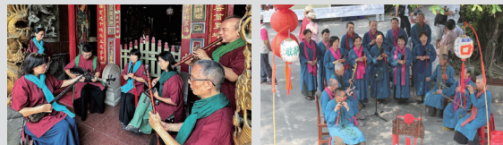
タイナンシンセイシャ マードウシャンコウジューインシャ