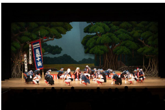
ニンブチャー（念仏踊り）