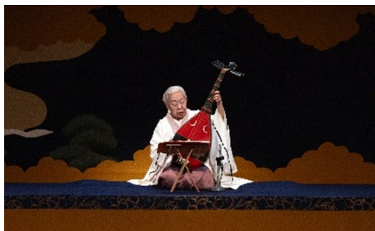
筑前琵琶 『屋島』 奥村旭翠