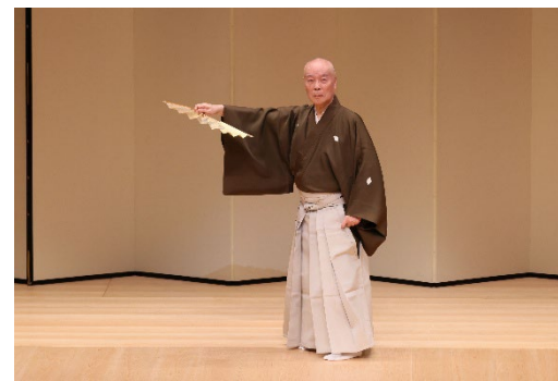
〈素踊りの会〉 長唄 『四季の山姥』 尾上墨雪