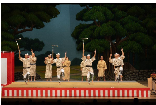
舞踊「コームッサー」