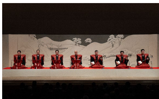
常磐津節 『宗清—恩愛贖関守—』 常磐津—佐太夫ほか