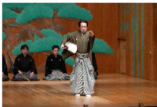
仕舞（観世流）玉ノ段