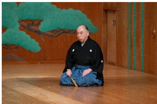
独吟（観世流）起請文