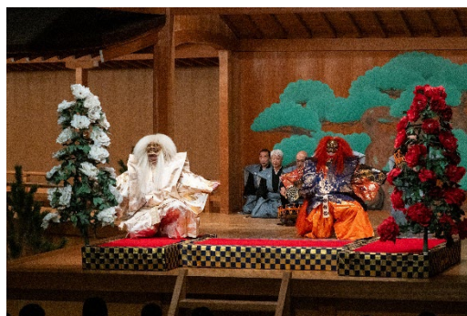
能（金剛流）石橋 和合連獅子