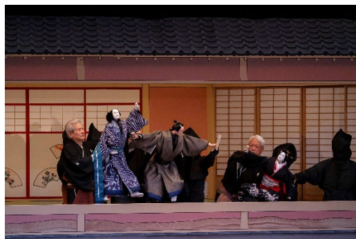
『心中天網島』北新地河庄の段