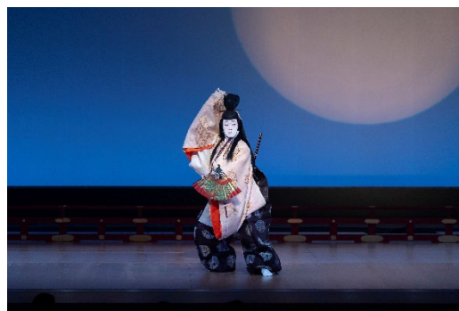
地歌 『融』 山村友五郎