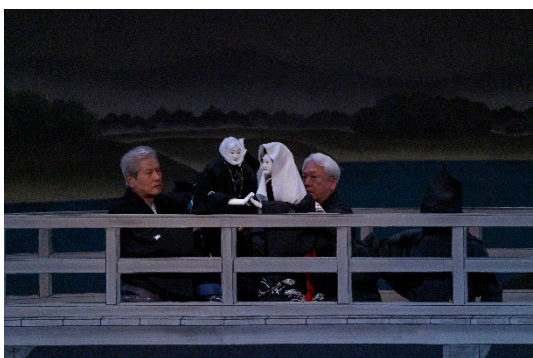
『心中天網島』道行名残の橋づくし