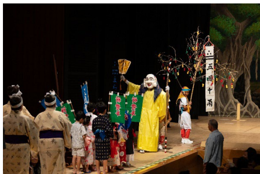
ミチサネー（ミルク行列）