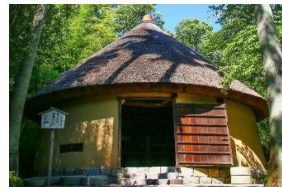
カトーレック株式会社/四国村