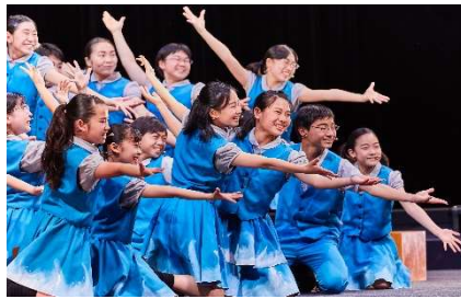
日本カバヤ・オハヨーホールディングス株式会社 /岡山子どもミュージカル