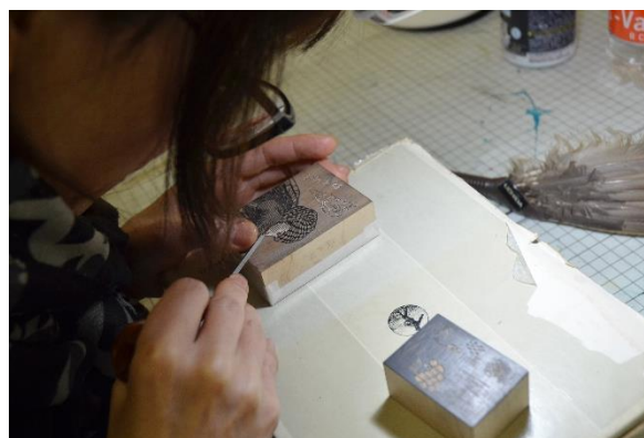
版画ワークショップ「木口木版講座」（2019 年）の制作の様子