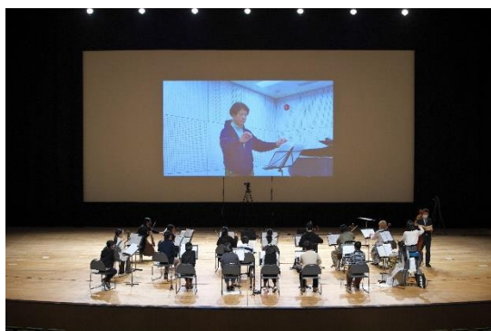
トヨタ青少年オーケストラキャンプ 7地域の会場を結んだオンラインレッスン(2021年3月)