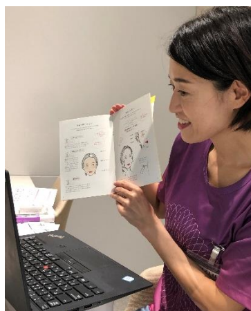
資生堂スタッフによるオンライン個別メイクアップレッスンの様子