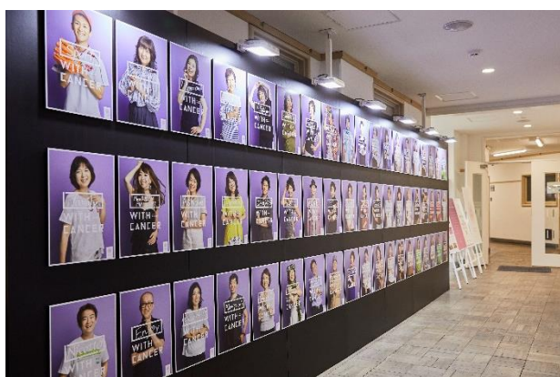
写真展で掲示されたがんサバイバーのポスター