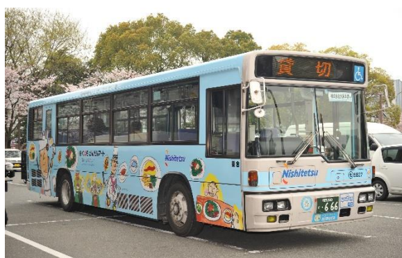
大賞作品を載せて福岡市内を走る [だんだんアートバス]