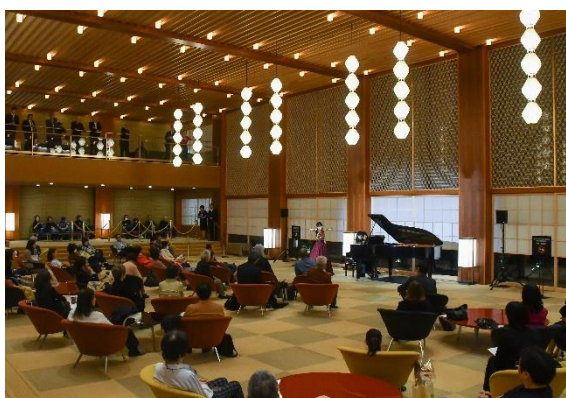
建替え後のコンサートの様子。静かなロビーが優雅な音色に包まれる