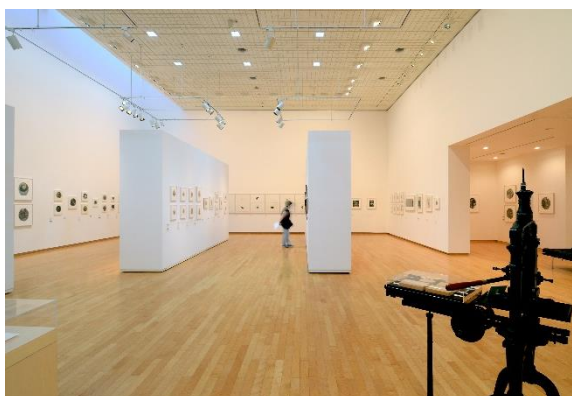
25 周年記念展「共鳴する刻 [しるし] —木口木版の現在地」の会場風景