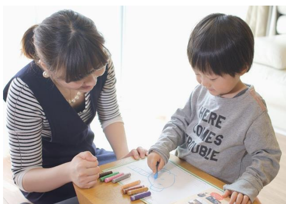
親子での取り組みの様子