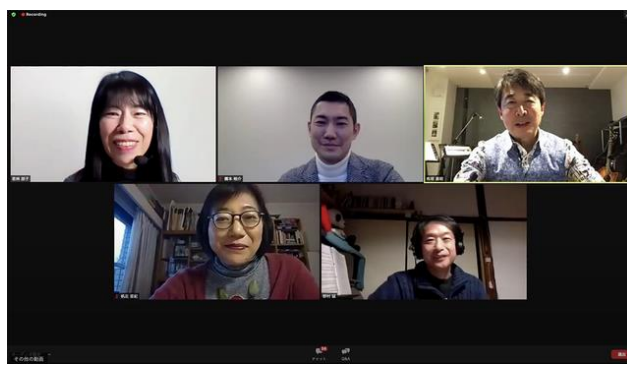
ネットTAM オンライントーク 「これでいいのか?! コロナ以降のアートマネジメント」