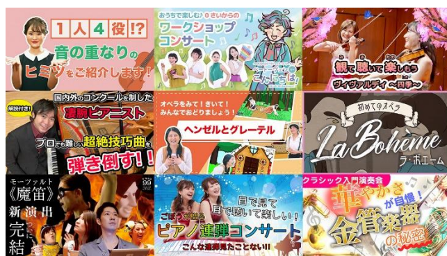
ピアノやヴァイオリン、打楽器、声楽など多様な音楽動画コンテンツをユニークに紹介