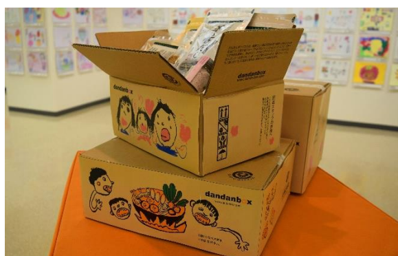
大賞作品が描かれた [だんだんボックス] で、商品を全国へ届ける