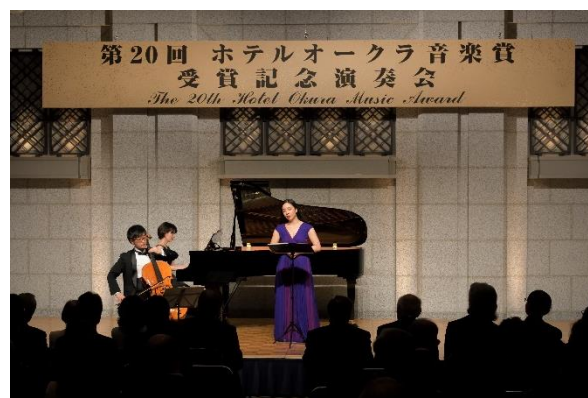
受賞記念演奏会では、毎回200名のお客様を無料招待している