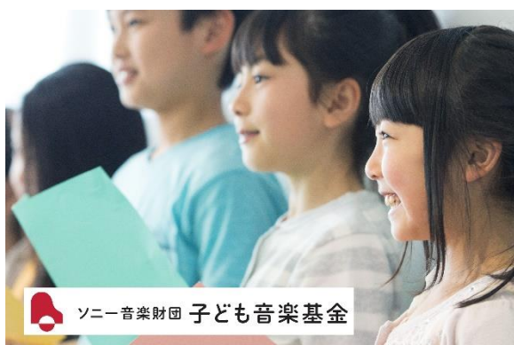
2020年度の助成贈呈式はオンラインで実施し、アーカイブ動画を公開している