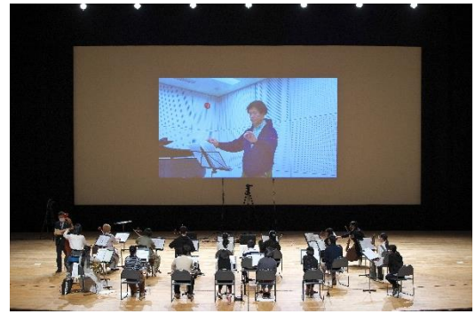
メセナ大賞:トヨタ自動車(株)「パンデミックの中でのプチ幸せの量産」

日本国内に所在する企業や企業財団、またそれらの連合体が、2020年4月1日から2021年3月31日に実施したメセナ(芸術文化振興による豊かな社会創造)活動で、「This is MECENAT 2020」認定活動164件(96社・団体)を対象に選考。