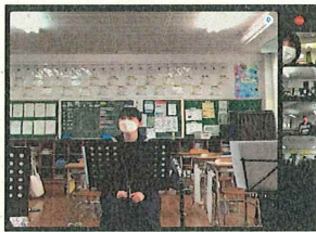
【オンライン練習の様子②】