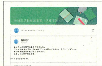
【Google classroom の画面】