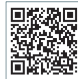
昨年度の実施内容