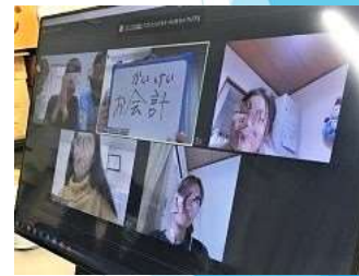
動画の内容をベースに、コーディネーターを店員、学習者を客として実践！ 思わぬアレンジや、難しい言葉も。 出てきた言葉はホワイトボードに書いて共有。