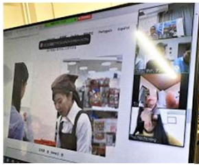
みんなで「つなひろ」を視聴