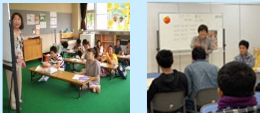
（文化庁委託事業による地域の日本語教室の例）