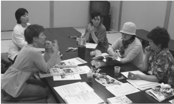
【右】生徒の募集について協議中。