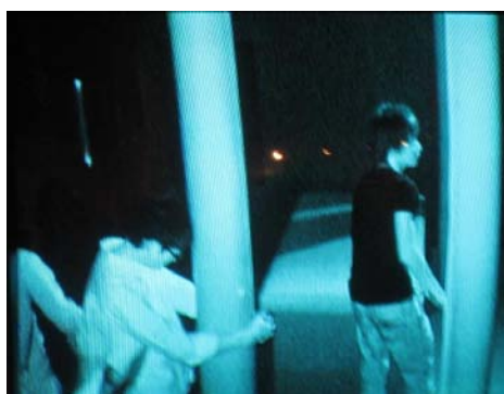
【社会科見学「横浜市民防災センター見学」

地球っ子教室では、子どもたちの漢字学習に対するモチベーションを上げるために年間2回漢字学習会を行っています。このときの問題は教育漢字を中心に教室の教師が独自に開発したものを uses。母語や学年、日本語の習熟度が異なってもみなが楽しんで学習できるように工夫をしグループ単位で学習します。