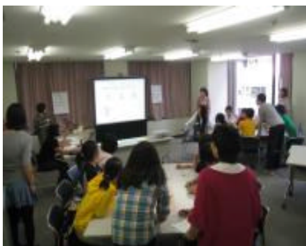
【第6回漢字王決定戦：グループによる漢字学習会】

通常の教室は教師1名に対し、1~2名で勉強をします。小学生も中学生も各自の日本語の進度に合わせて、授業前に各児童生徒別に教材を準備し、2時間勉強します。高校受験を控えた子供に対しては特に受験科目について集中的に指導を行っています。