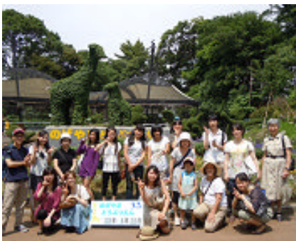
社会科見学 20110625 ※土曜教室