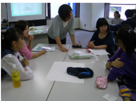
教室活動: 漢字王決定戦 20120303