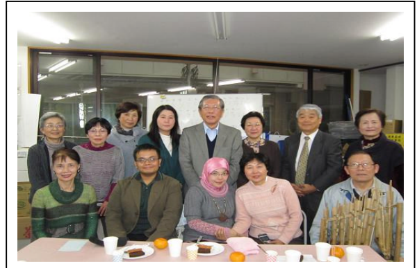
帰国の女生徒（中央）お別れ会