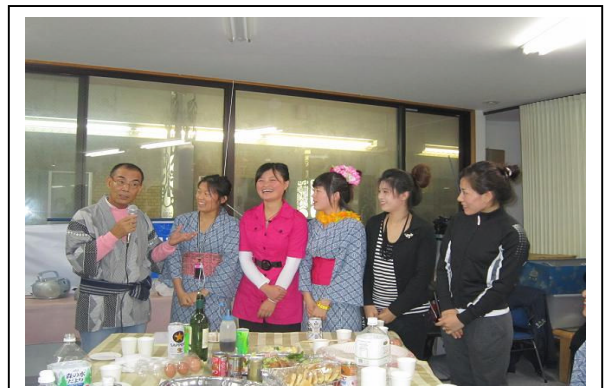
花笠踊り打上懇親会