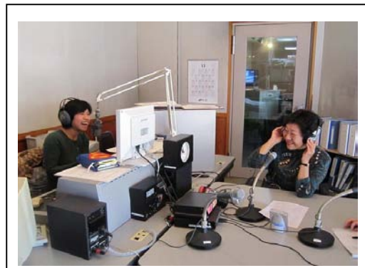
FMいとうラジオによる生徒募集PR