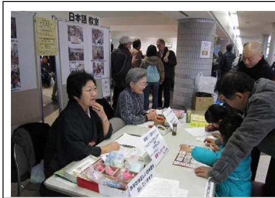
交流フェスタ 日本語教室ブース