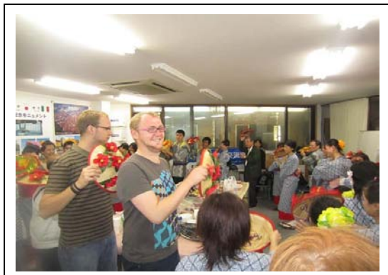
地域イベントへ参加花笠踊り