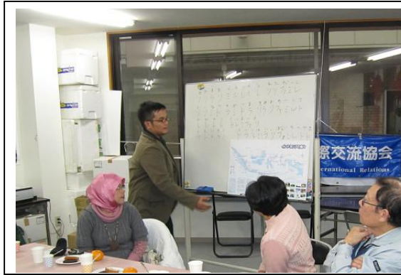
生徒の日本語による出身国の説明