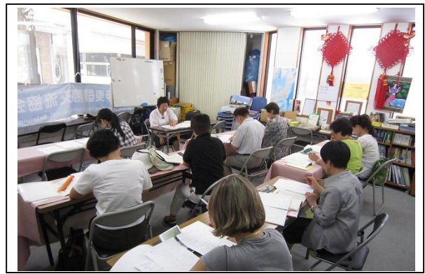
講師能力アップ学習会