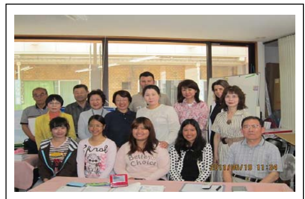
新しい受講者と講師