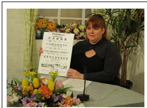
ケーブルテレビ出演生徒募集PR