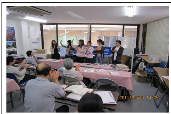
受講生の自己紹介