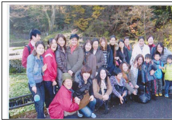
課外授業は日本語課外体験