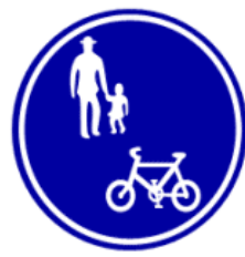
自転車及び歩行者専用

ほしつしゃ じくんしゃ づつしつ 歩行者と自転車だけが通行 せんようどうろ できる専用道路です。