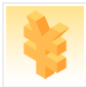
代办各种费用支付