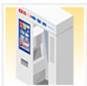
证明照片自动摄影机