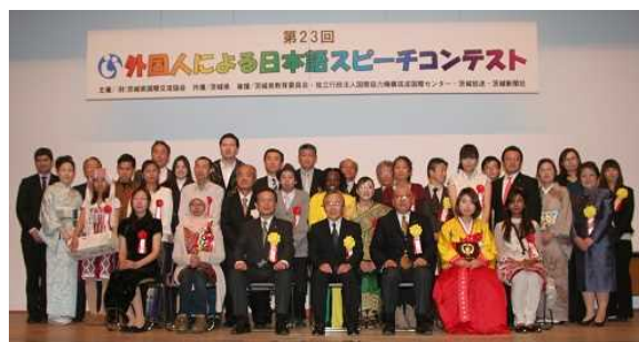
第23回外国人による日本語スピーチコンテスト