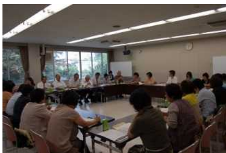
日本語ボランティアネットワーク会議