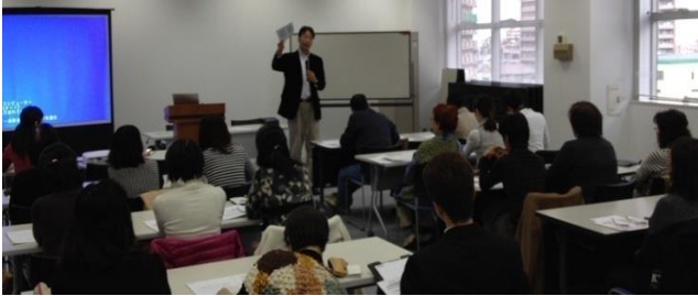
多文化共生社会を担う外国人児童生徒の国語力を考える