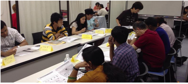
日本語教室(クリエート)