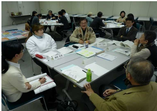
セーフティネットとしての地域 日本語教室開設・運営強化事業