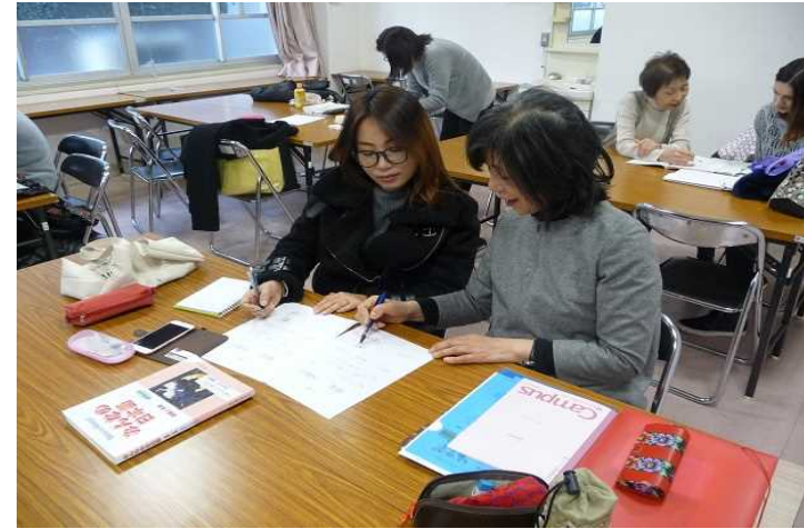
外国人県民の居場所づくり