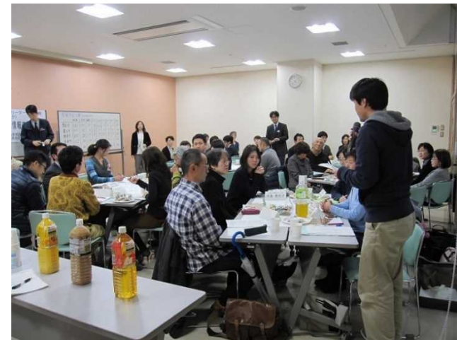
地域日本語教室リーダー養成講座