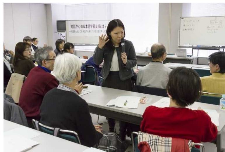
日本語教育研修会