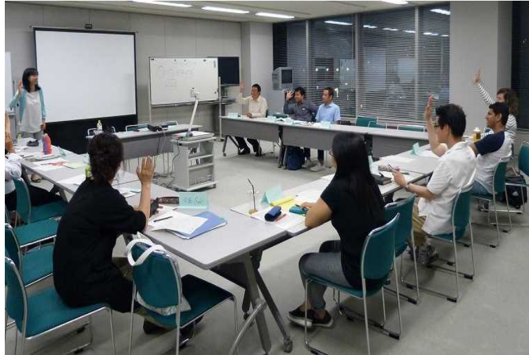
外国人県民対象日本語講座