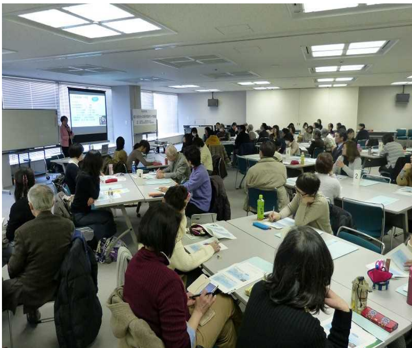
外国人児童生徒への日本語・学習支援研修会