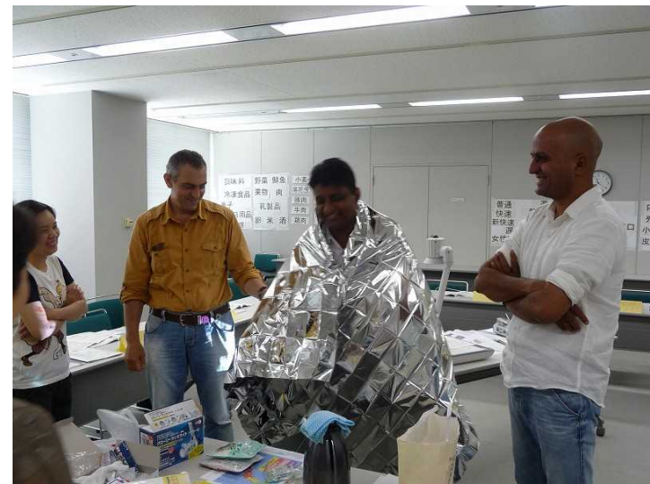
すぐに役立つ日本語講座