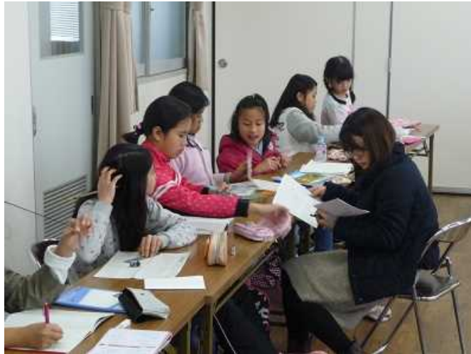
外国人児童生徒の居場所づくり