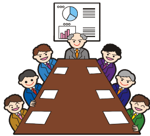
カリキュラム等開発委員会