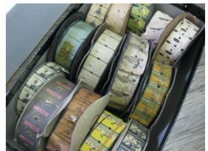
紙フィルムのデジタル化