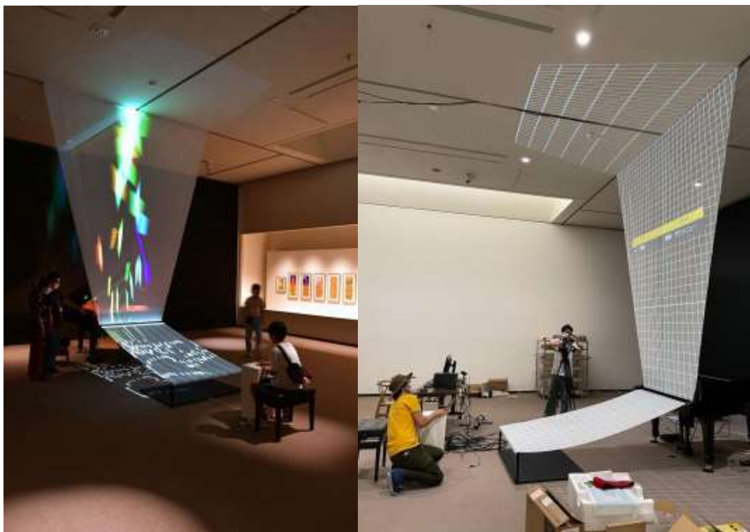
(左) 《映像装置としてのピアノ》の展示風景（茨城県近代美術館）