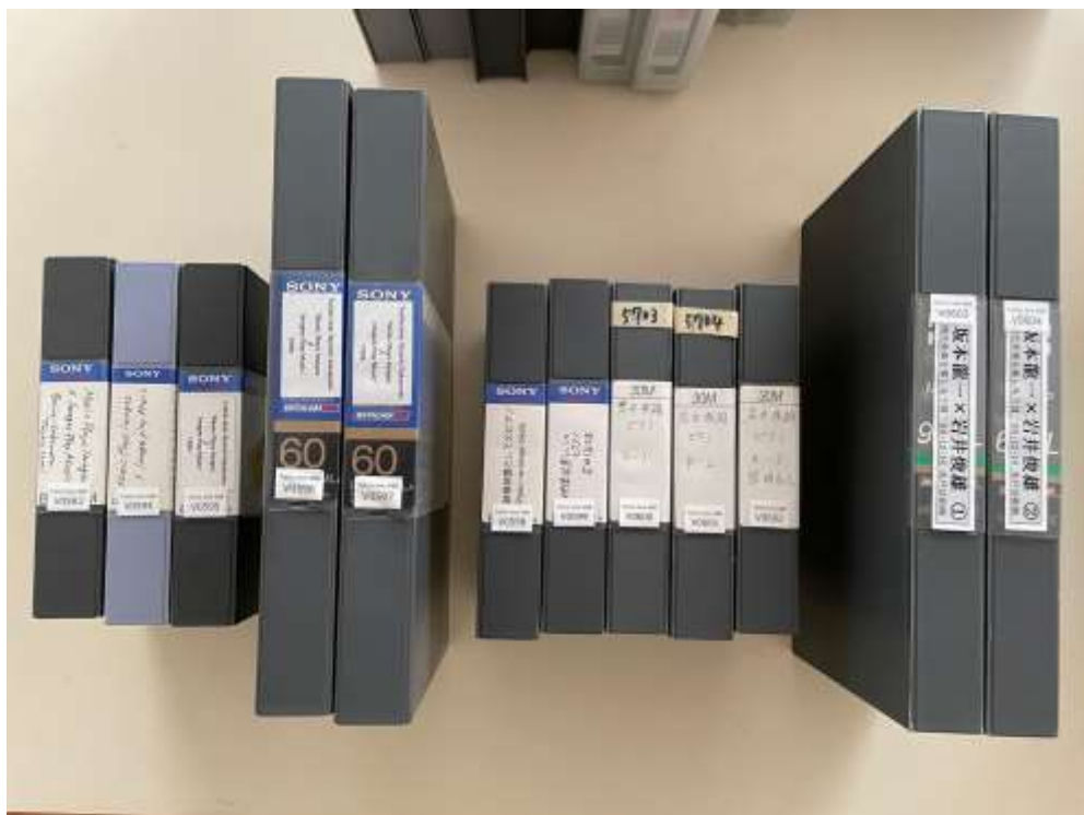
映像資料は全てナンバリングし棒リストを作成