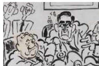
顔の部分に紙を貼って修正が行われている。