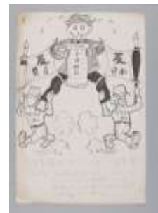
朝日新聞に掲載された政治漫画の原画