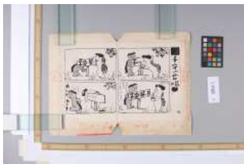
赤鉛筆での指示や原稿の加工が見られる。