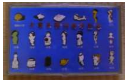
東京都民の日を記念した大東京祭記念バッジ

長崎市出身の清水崑（1912～1974）は、漫画集団の代表的なマンガ家の一人である。彼が描いた政治マンガは吉田内閣を中心に激動の戦後を、ユーモアを交えて伝えている。また、河童が人間のように生活する「かっぱもの」と呼ばれるマンガは大衆に広く受け入れられ河童ブームを巻き起こした。この残り香は現在も、黄桜酒造の河童のCM、東京都民の日のバッジ、かっぱえびせんの名称に見られる。