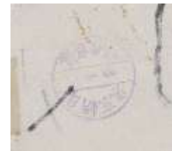
政治漫画に押印された朝日新聞の印