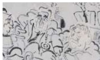
修正前の絵が裏面から見える。顔の角度や表情が異なる。