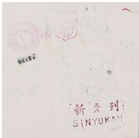
政治漫画に押印された新夕刊の印とGHQの検閲印

れており、これにはGHQの検閲印が見られる。政治漫画は、当時の政治や世相を表現しており、近現代史に関する研究活動への利用などが想定される。また、清水崑展示館の展示でも、撮影した高精細画像が利用されており、今後の活用が期待される。