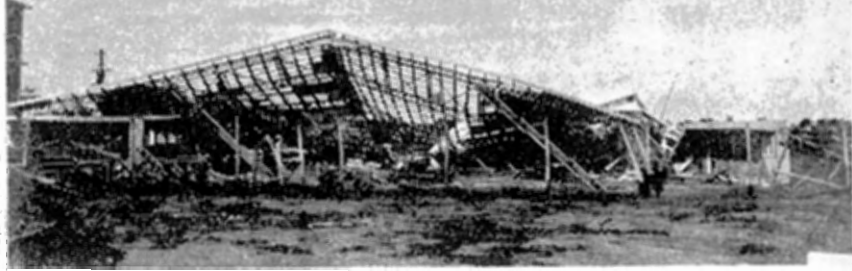
鉄骨体育館の全壊（三重県伊勢高校）