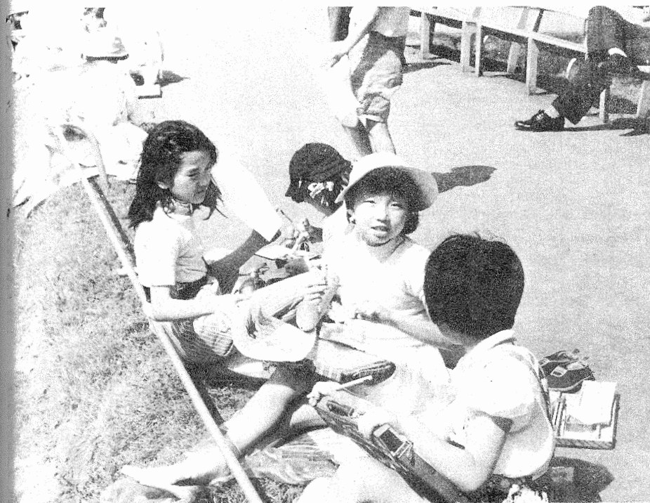
絵をかく子どもたち