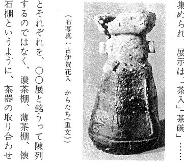
（右写真）古伊賀花入 からたち（重文）

八幡太郎義家の奥州攻（前九年の役）で滅亡した安部頼時の遺子・貞任・宗任兄弟が再挙を図る苦心をテーマにしたスケールの大きな長編で、技巧派の最高峰近松半二ほかの代表作である。宝暦十二年（一七六二）九月大坂竹本座で初演された。原作は人形浄瑠璃だが、歌舞伎でもくりかえし上演されている。安部頼時の妻岩手や貞任宗任兄弟が艱難辛苦の果に挫折する過程のなかに奥州の代表的な伝説でもある謡曲の「黒塚（安達原）」を巧みにとり入れた典型的な五段続きの時代ものである。眼目は二幕目の環宮明御殿と四幕目の安達原一つ家で、御殿には「袖袷祭文」偽勅使「僥倖切腹」の見せ場があり、今回は勘三郎が袖袷・貞任の二役早替り