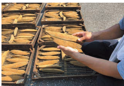
土佐節の製造技術 (高知県)