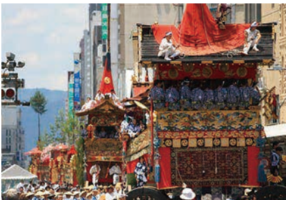
京都祇園祭の山鉾行事 (京都府京都市)