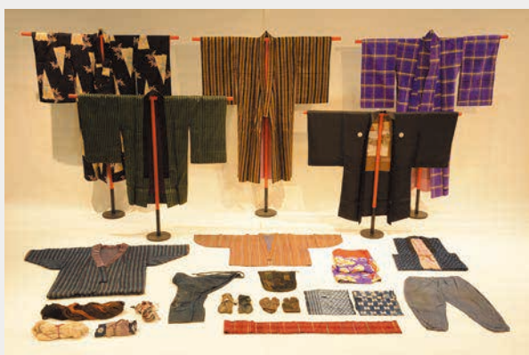
清瀬のうちおり:469点 (東京都清瀬市)