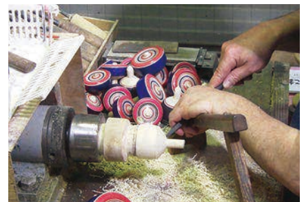
大山こまの製作技術 (神奈川県伊勢原市)