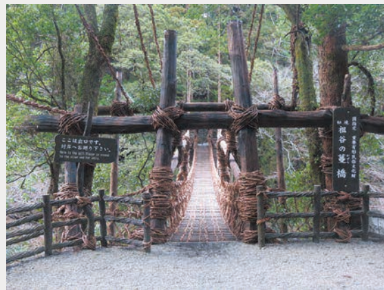
祖谷の蔓橋:1件 (徳島県三好市)