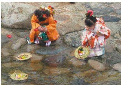
用瀬の流しびな (鳥取県鳥取市)