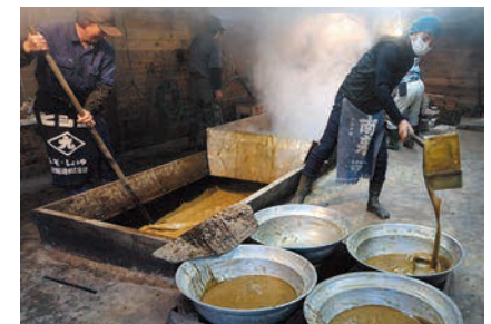
薩南諸島の黒糖製造技術 (鹿児島県)