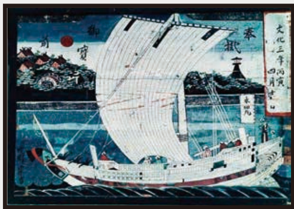
白山媛神社奉納船絵馬:52点 (新潟県長岡市)