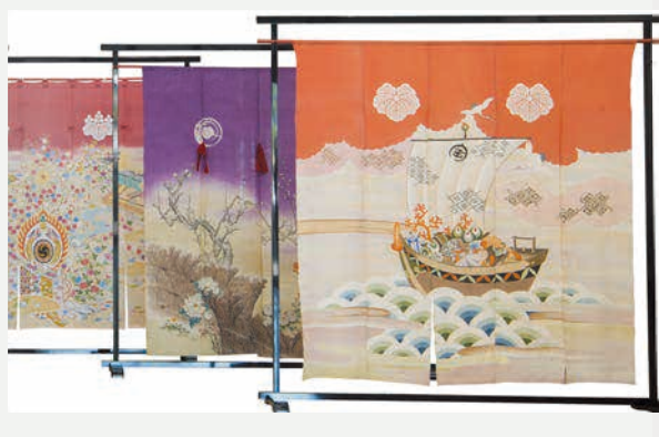
七尾の嫁暖簾:103点 (石川県七尾市)