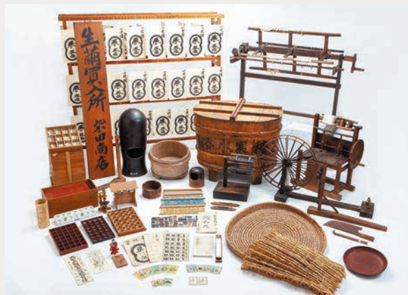
伊達の蚕種製造及び養蚕・製糸関連用具:1,344点 (福島県伊達市)