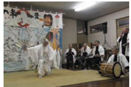
鳥海山北麓獅子舞番楽 (秋田県由利本荘市、にかほ市)