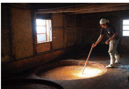
讃岐の醤油醸造技術 (香川県)