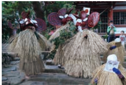
薩摩硫黄島のメンドン (鹿児島県三島村)