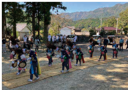
葉山の花取踊 (高知県津野町)