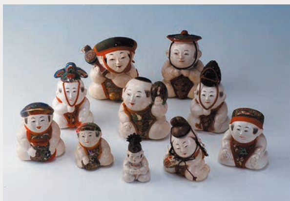
京都の郷土人形コレクション:3,845点 (京都府京都市)