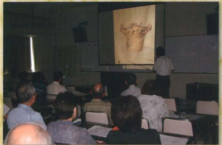
埋蔵文化財公開講座

埋蔵文化財保存活用整備事業費国庫補助とは、以下のような事業を行うために必要な費用の一部を国が補助するものです。