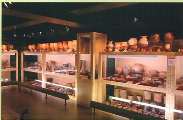
埋蔵文化財センター展示室の展示棚整備

埋蔵文化財の発掘調査およびその成果の整理、収蔵、展示等を行う拠点となる施設を整備する。