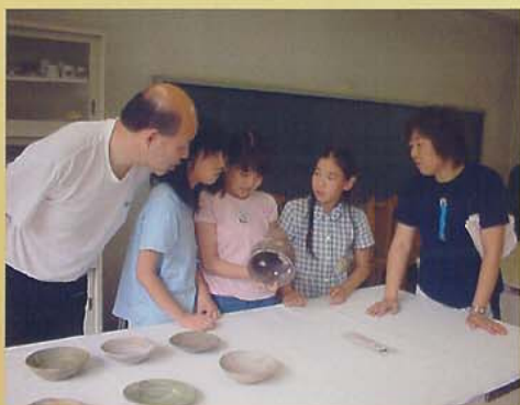
出土遺物の出前展示