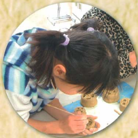
土製耳飾り作り体験学習