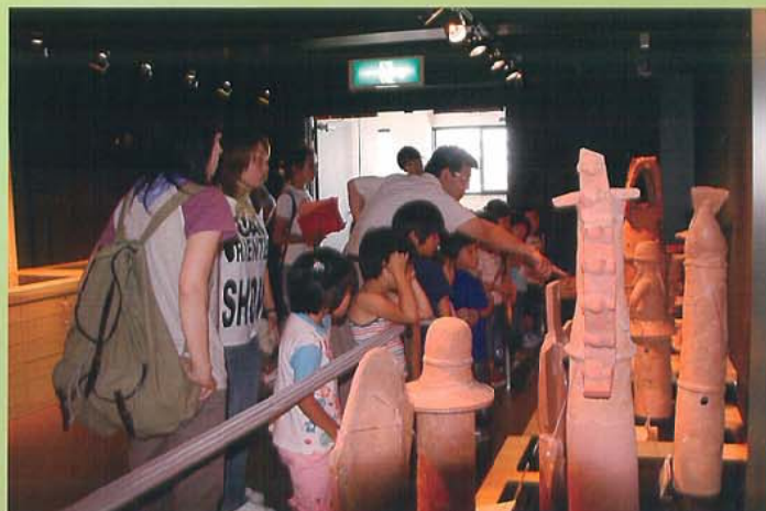
遺物収蔵庫を展示室に改修