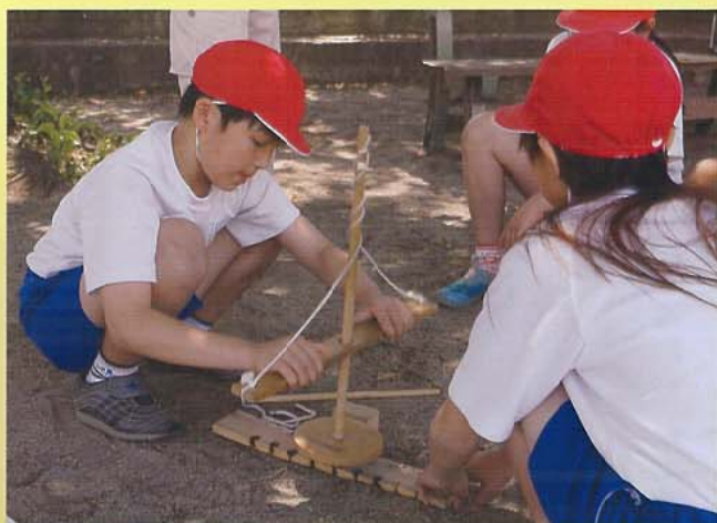
火おこし体験学習