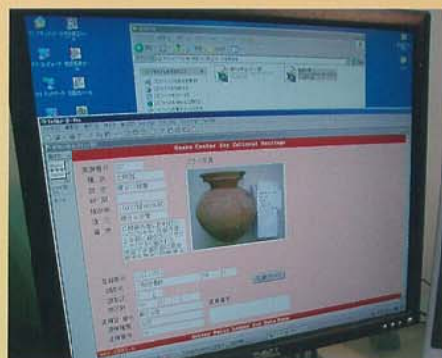
出土遺物のデータベース作成