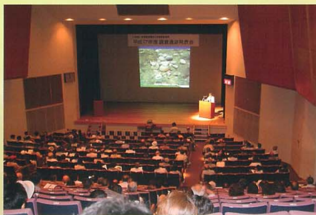
一般向け埋蔵文化財講演会