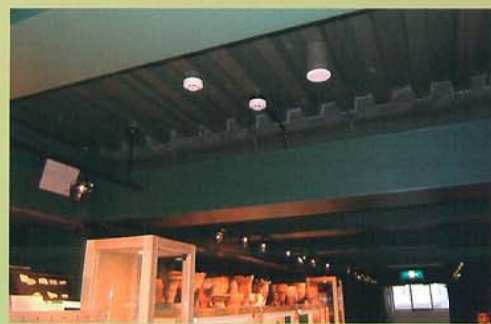
展示室にスプリンクラーを設置