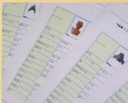
遺物整理台帳の整備