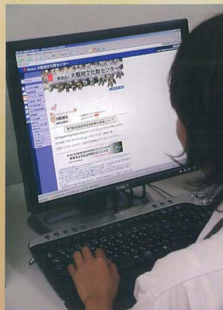
ホームページの作成