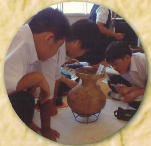
出土遺物による出前授業