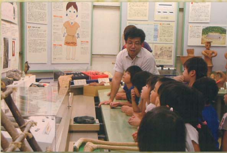
埋蔵文化財センターに展示室を設置