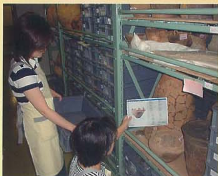
台帳の整備と遺物再収納

これまで蓄積されてきた発掘調査成果を再整理して確実に保存するとともに、活用できる状態にする。