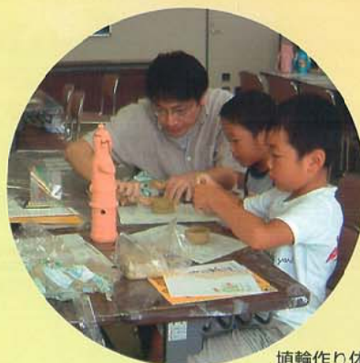
埴輪作り体験学習