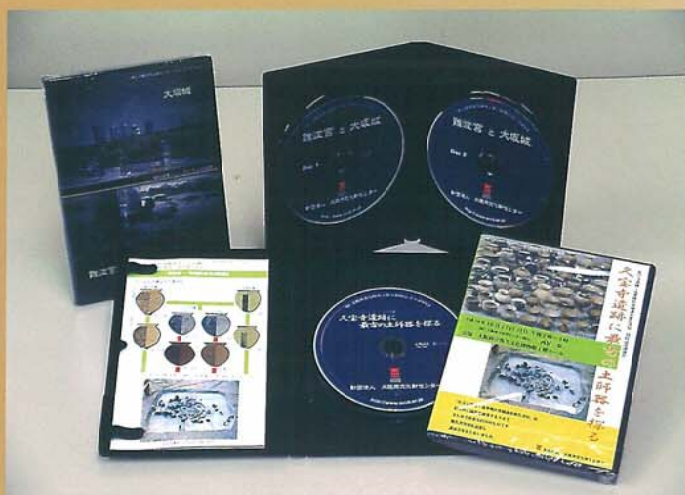
埋蔵文化財広報用のDVD作成