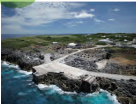
北大東島の燐鉱山由来の文化的景観（沖縄県北大東村）