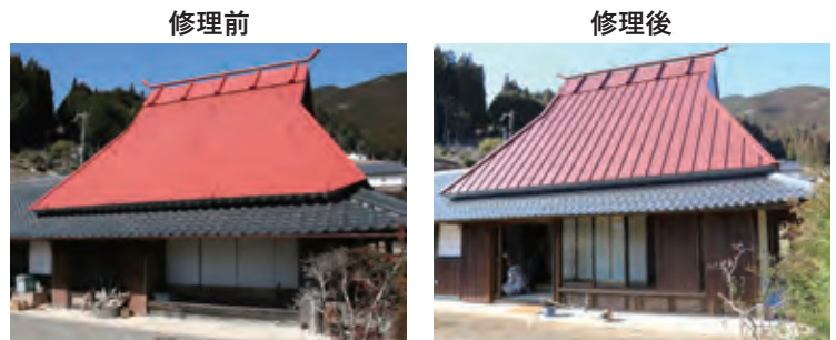
蘭島及び三田・清水の農山村景観（和歌山県有田川町）