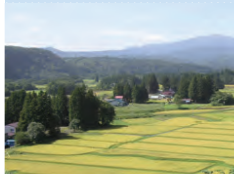
一関本寺の農村景観（岩手県一関市）