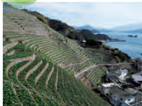
遊子水荷浦の段畑（愛媛県宇和島市）