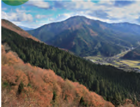
智頭の林業景観（鳥取県智頭町）