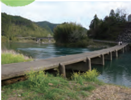
四万十川流域の文化的景観 中流域の農山村と流通・往来（高知県四万十町）