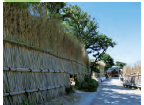
大沢・上大沢の間垣集落景観（石川県輪島市）