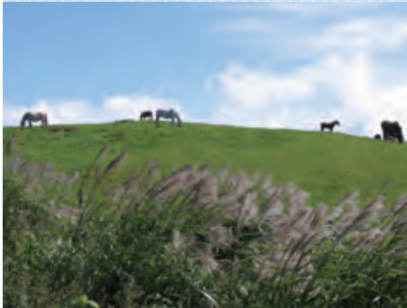
遠野 荒川高原牧場 土淵山口集落（岩手県遠野市）