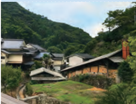
小鹿田焼の里（大分県日田市）