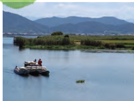
近江八幡の水郷（滋賀県近江八幡市）