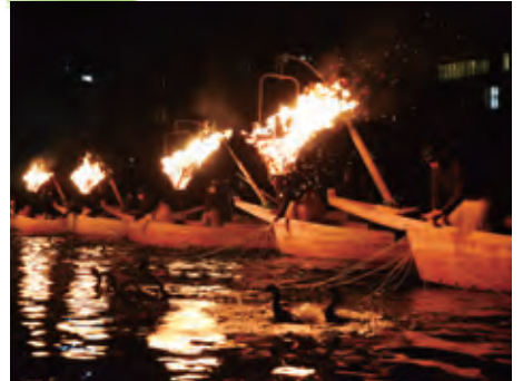
長良川中流域における岐阜の文化的景観（岐阜県岐阜市）