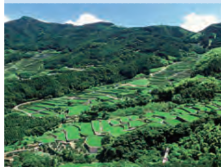
蕨野の棚田（佐賀県唐津市）