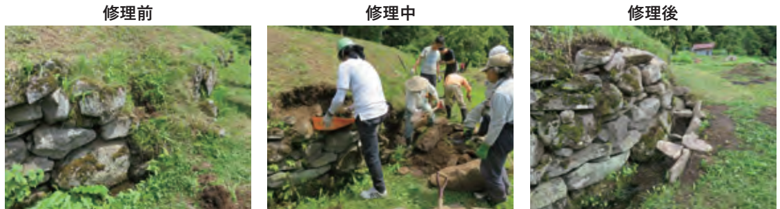
小菅の里及び小菅山の文化的景観（長野県飯山市）