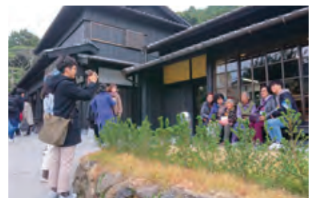
平戸島の文化的景観（長崎県平戸市）