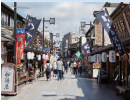
葛飾柴又の文化的景観（東京都葛飾区）