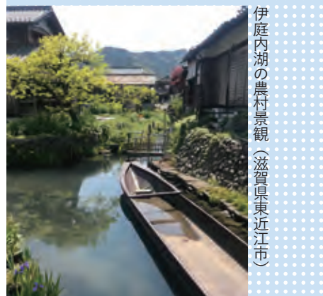
伊庭内湖の農村景観（滋賀県東近江市）