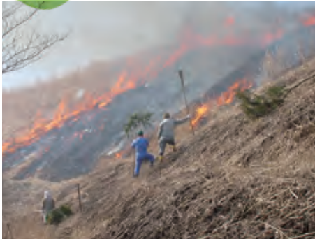
阿蘇の文化的景観 阿蘇北外輪山中央部の草原景観（熊本県阿蘇市）