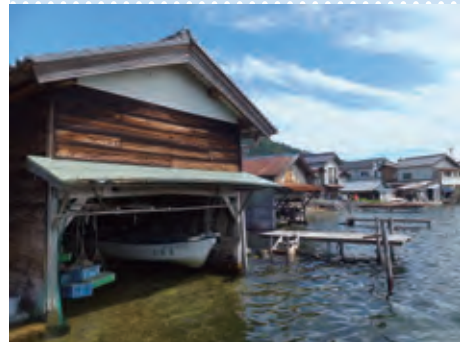
宮津天橋立の文化的景観（京都府宮津市）